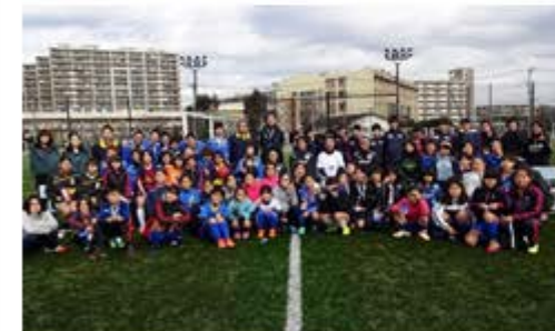
記念写真をパチリ。皆さんお疲れ様でした！