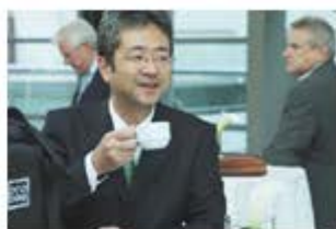
ここはどこ?後ろには外人の姿。某コーヒーのCM「違いが判る男」シリーズに出てくるような、この代表は一体!?詳細は左下

今回(16号)は、「海外事業とグループの現況」について、代表にお話を伺いました。皆さんは海外事業と聞くと、具体的にどういふことを想像するでしょうか?その点を代表へストリートに聞いてみました。 現在のカインズグループの柱は、何と言っても「取付キット事業」です。取付キットは決して衰退することはありませんが世の中の環境に順応して形を変えていかないとダメです。また、国内だけでやっていては、いすれ国内の市場は成熟し今後の事業の成長はありません。やはり、いかにしてグローバルに取り組んでいくかが今後の事業の存続・成長のカギになります。しかし、いくら海外と云っても決して簡単なことではなく、さまざまな障壁・ハードルがあり、腰が重いのも本音だそうです。国内車と海外車は仕様が違います。そして、どの国に拠点を持つかにもよりますが、その国々によって法人(拠点)を持つ為の条件が違います。国内においての取付キット事業のビジネスモデルは、いかにして車を