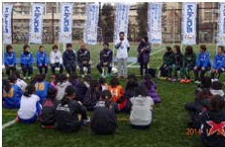
トークイベントの様子

ngs選手、横山監督と代表による「夢」をテーマとしたトークイベントも開催するなど、初めての試みでしたが、子供たちももちろん南葛S.C. Wingsの選手、監督、コーチなど、皆さんの笑顔がとても印象的でした。