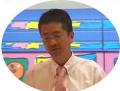
ハウリングで投げ終わったあとのショックを隠しきれない代表